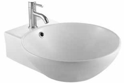
Dew 47 mosdó 47 x 56 cm 7019 47 xx