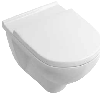
Mélyöblítésű fali-WC 4V99 RO xx WC-ülöke: 8M38 S1 01, 8M39 61 01