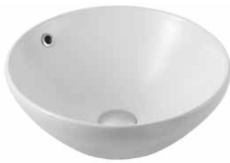
Dew 47 ráültethető mosdó 47 cm 7029 47 xx