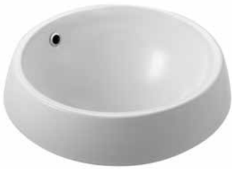
Nur 47 ráültethető mosdó 47 cm 7014 47 xx

Az Alföldi új családja számtalan variációs lehetőséget kínál a fürdőszobában a mosdók széles választékának köszönhetően. A ráültethető mosdókkal igazán különleges, egyedi megjelenés alakítható ki. Az új nyitott gyűrűs, CleanFlush fali-WC pedig ma már standard megoldás a fali-WC-knél, használatával a WC egyszerűen és gyorsan tisztán tartható, miközben nem kell tartanunk a víz kifröccsenésétől sem. Ráadásul, pedig - bizonyos feltételek mellett - a 3/4,5 literes öblítésnek köszönhetően még vizet is spórolhatunk. A család minden tagja választható a takarítást jelentősen megkönnyítő Easyplus mázfelülettel.