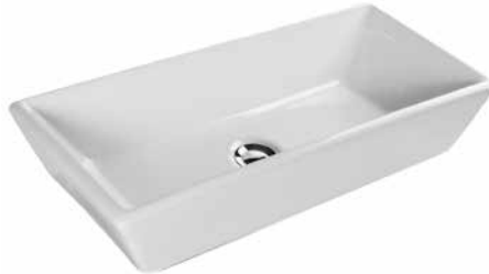
Now 66 ráültethető mosdó 66 x 29 cm 7016 65 xx